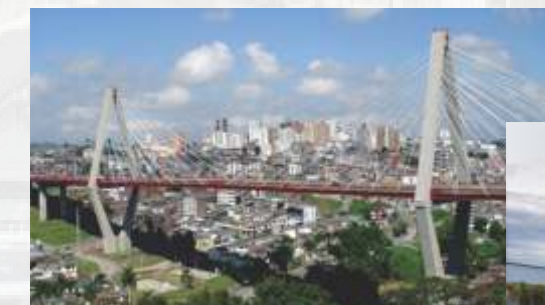
El viaducto César Gaviria Trujillo