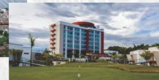
Hotel Sonesta, Pereria