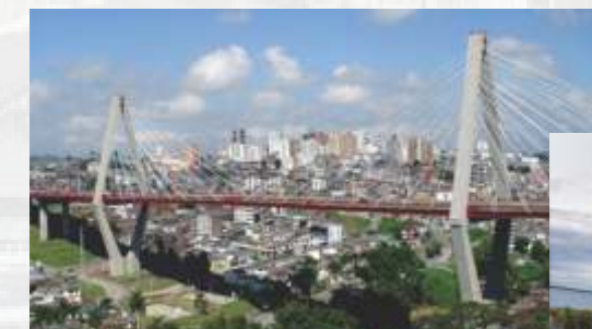
El viaducto César Gaviria Trujillo